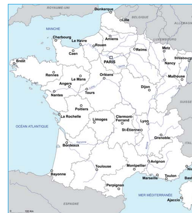
Les principales villes de France.

Le réseau urbain français a longtemps été l'un des plus déséquilibrés du monde : Paris (9,5 à 11 millions d'habitants) concentre 20 % de la population et est de 7 à 8 fois plus peuplée que Marseille (1 350 000), deuxième agglomération du pays. Cette situation contraste avec celles de l'Allemagne, de l'Italie, de l'Espagne ou des États-Unis. Mais l'explosion des capitales du tiers-monde et l'accession à l'indépendance de petits pays centrés sur une grande ville, comme la Lettonie dont 40 % de la population vit à Riga, relativise cette particularité.