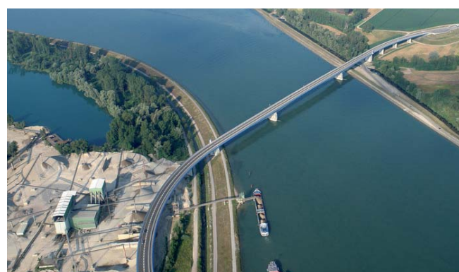
Le pont Pierre Pflimlin est l'un des huit ponts sur le Rhin reliant la France et l'Allemagne. Situé au sud de Strasbourg, il a été inauguré en 2002.

la France a perdu Landau, en aval de l'Alsace, qu'elle possédait depuis des siècles ; jusqu'au xv e siècle, la Flandre était française. La France a longtemps rêvé d'annexer la Belgique et toute la rive gauche du Rhin, « frontière naturelle » au moins sur les cartes : cela explique en partie les deux tentatives de satelliser la Sarre, en 1919-1935 et en 1945-1956. Elles provoquèrent non seulement des conflits avec l'Allemagne, mais aussi des tensions avec le Royaume-Uni, soucieux de la liberté des bouches du Rhin, débouché naturel de son commerce en Europe.