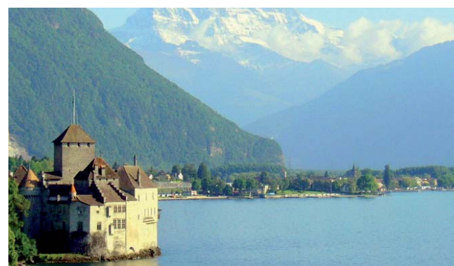
Au milieu du lac Léman passe la frontière franco-suisse ; la rive nord et les deux extrémités sont suisses, tandis que la rive sud est en France.